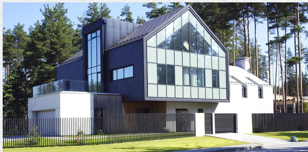
▲ Современный дом в КП «Охтинский парк».

«Иногда задумка архитектора принимает некие футуристические формы. Заказчик этого проекта (сфера IT) хотел, чтобы один дом стоял на другом. Это немного напоминает те картины, которые привычны для людей, работающих с компьютером. Но там-то они создаются искусственным интеллектом в виртуальном пространстве, а мы работаем в реальности, с иными законами физики. Однако творческий подход к работе с бетоном и профессионализм конструктора позволили воплотить современный замысел архитектора», – подчёркивает генеральный директор компании «Ответ».