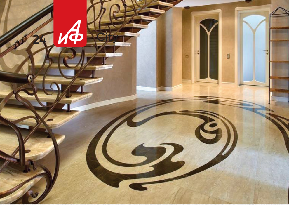
▲ Пол из керамогранита с ручной укладкой узора из камня Emperador в особняке под Петербургом.